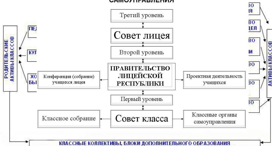
СХЕМА ТРЕХУРОВНЕВОЙ СТРУКТУРЫ ЛИЦЕЙСКОГО САМОУПРАВЛЕНИЯ