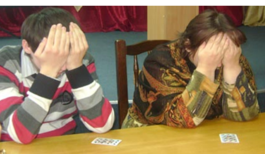
"MAFIA" не дремлет...

Минула насыщенная половина учебной недели. Четверг – День истории, географии, обществоведения. Дебаты среди учащихся 9-х классов на тему: «Книги ушли в прошлое. Их заменил компьютер» показал ребятам, как непросто высказывать своё мнение, отстаивать свою позицию. Долгожданная всеми игра «MAFIA» между педагогами и лиценстами вызвала шквал аплодисментов.